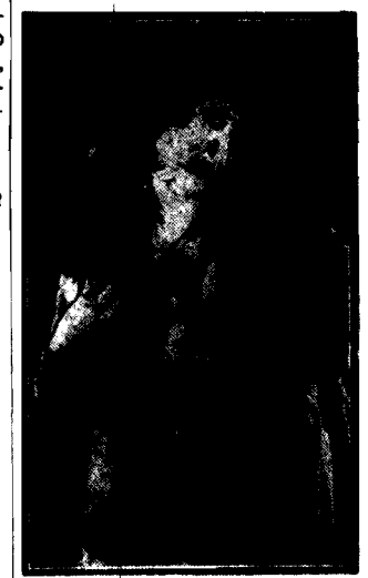
Jest znowu modny przy jasnej sukni lub kostiumie