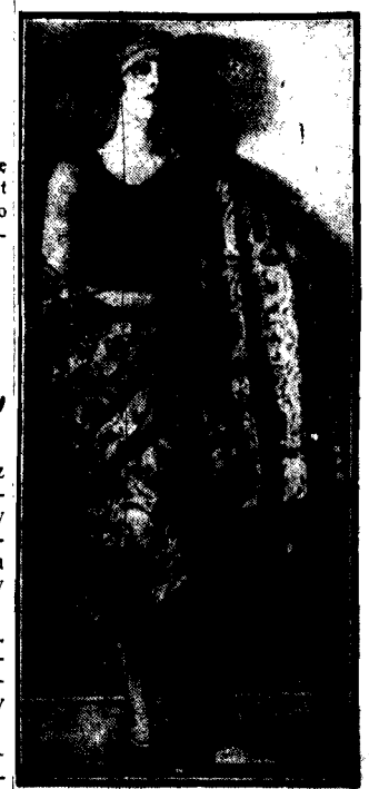
że ten strój wspaniały to, tylko płaszcz kąpielowy z jedwabistej tkaniny gumowej, ozdobionej fantastycznym deserciem w różnej kolorach.