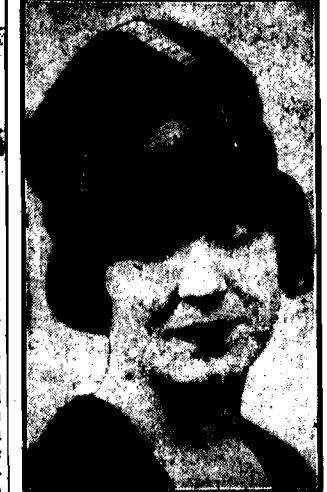
Najmodniejszy fason kapelusza: ekscentryczny i szelony, rondo z przodu i podziałką.